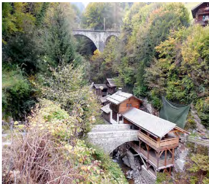
Moulins de la Tine - Troistorrents

Le jour est à peine levé que déjà le car, avec les 27 participants, file sur l'autoroute. A Ollon le soleil pointe son nez derrière les montagnes. Nous allons visiter le Château de la Roche, en réalité une maison forte,